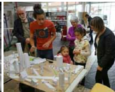
Archicity - Parcours d'Architecture