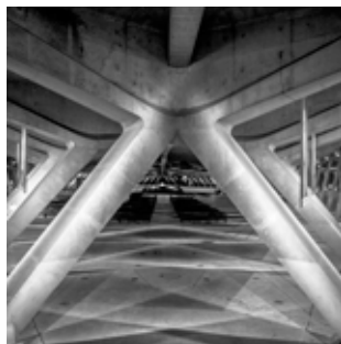
Sanctuaires de Lourdes - D. Banks