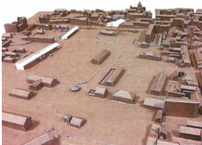
Maquette des Haras - Étudiants de l'école d'architecture de Paris-Belleville